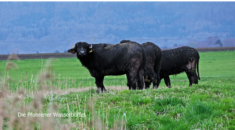
Die Pfohrer Wasserbüffel.