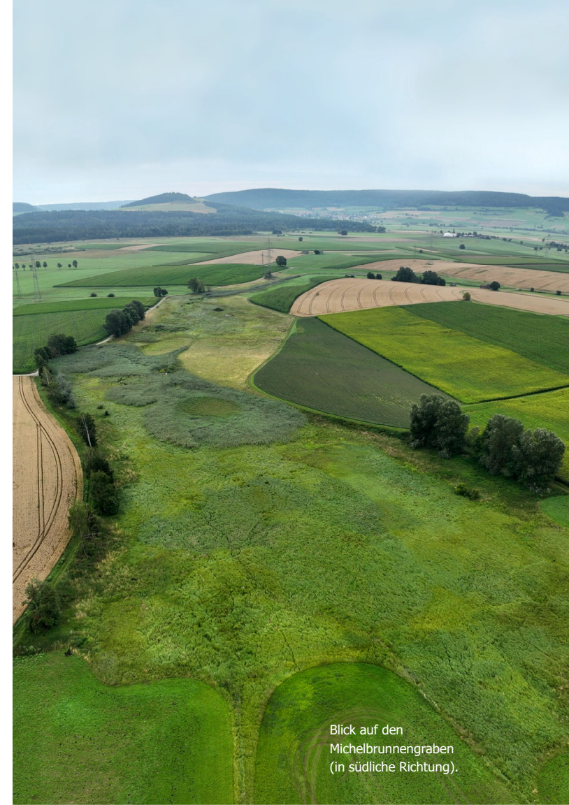
Blick auf den Michelbrunnengraben (in südliche Richtung).

Zur Planung der Exkursion und der Bewirtung bitten wir um eine formlose Anmeldung bis spätestens 10. Juli 2026 . Senden Sie dazu eine E-Mail an ngpbaar@irasbk.de oder rufen Sie uns an unter Telefon: 07721 913-7700 .