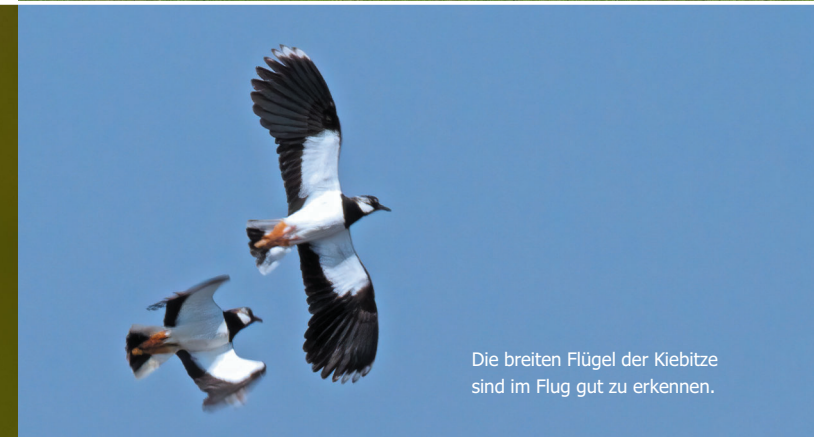
Die breiten Flügel der Kiebitze sind im Flug gut zu erkennen.